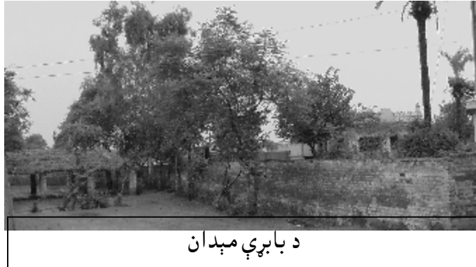
د بابرې مېدان

پینځویشتر روپو نه تر پینځه سوو روپو پورې جرمانه ولگېده. کوم خلقو چې جرمانه نه شوه ادا کولې نو د هغې په عوض کښې ئې د هغوي بچي گرفتار کړل او جېلونو ته ئې ولېږل. د پښتو د مشهور شاعر عبدالملک فدا خور په دې ډزو کښې شهیده شوې وه. له دې وجې نه عبدالملک فدا دوه سوه روپۍ جرمانه شومې ؤ ځکه چې د هغه په خور د سرکار ډېرې گولۍ خرابې شوې وې.