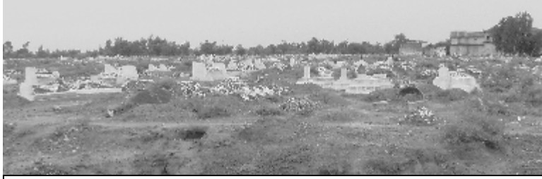
د بابري د شهيدانو هديره

ولگېدل او شهيدان شو. ما چې دا وليدل چې چارسدي بازار ته لارم او جلوس والو له مې