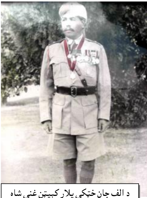
د الف جان خټکې پلار کپټن غني شاه

کله چې باچا خان د کوهات په دوره ؤ نو الف